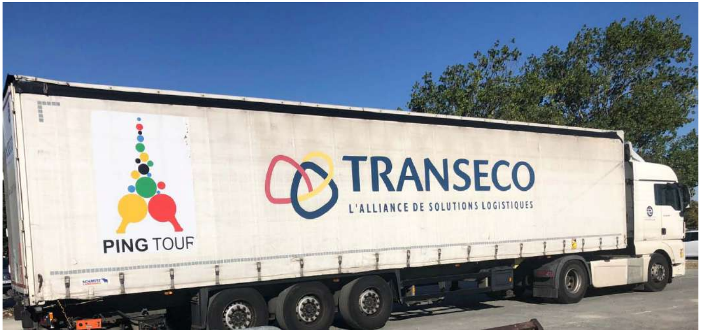
Le semi-remorque avec le matériel était sur le parking le 9 août à 20h.